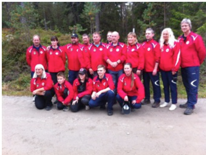
Norske landslagstroppen under Nordisk feltmesterskap 2013 på Mysen

Det blir avholdt treningsamling i forkant av mesterskapet. Tid og sted avhenger av hvor mesterskapet avholdes. Informasjon blir sendt de uttatte skytterne.