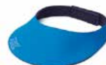
MEC SKYTEBREM ISSF