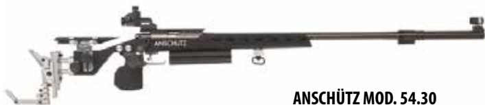
ANSCHÜTZ MOD. 54.30

Den nye toppmodellen med kortere låskasse og svart presiseskjeffe.