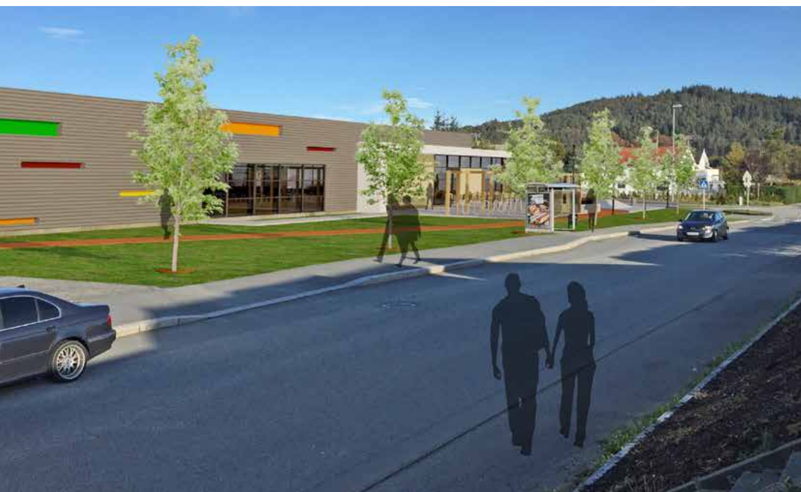
▶▶ Flerbrukshallen som snart bygges i gang i Haugesund

– I dag gjøres det lite for å få nye medlemmer fordi vi har kapasitetsproblemer, men når vi blir ferdig med den nye hallen skal vi virkelig legge til rette for å drive aktiv rekruttering igjen. Vi har allerede etablert