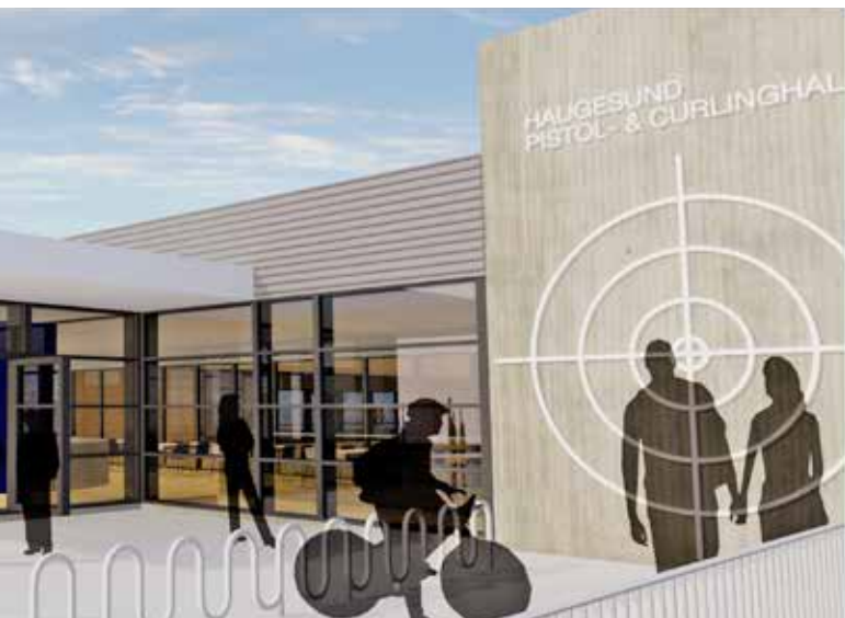
▶▶ Haugesund pistolklubb og curlinghall.

av befolkningen i by- og Haugalandet. Haugesund Pistolklubb er en klubb med medlemmer fra flere om-liggende kommuner, så det å få etablert et slikt bygg vil betjene alle interesserte.