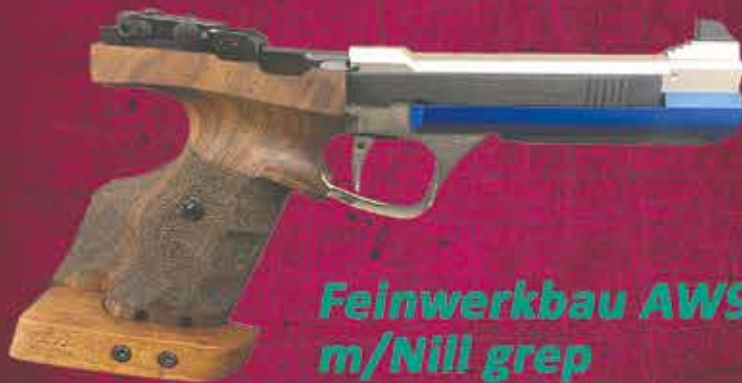
Feinwerkbau AW93 m/Nill grip