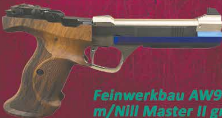
Feinwerkbau AW93 m/Nill Master II grip